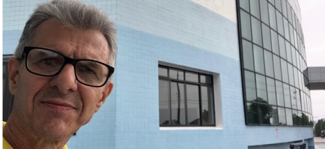
Após visitamos militares da PM e BM divulgando a palavra distribuindo revistas.