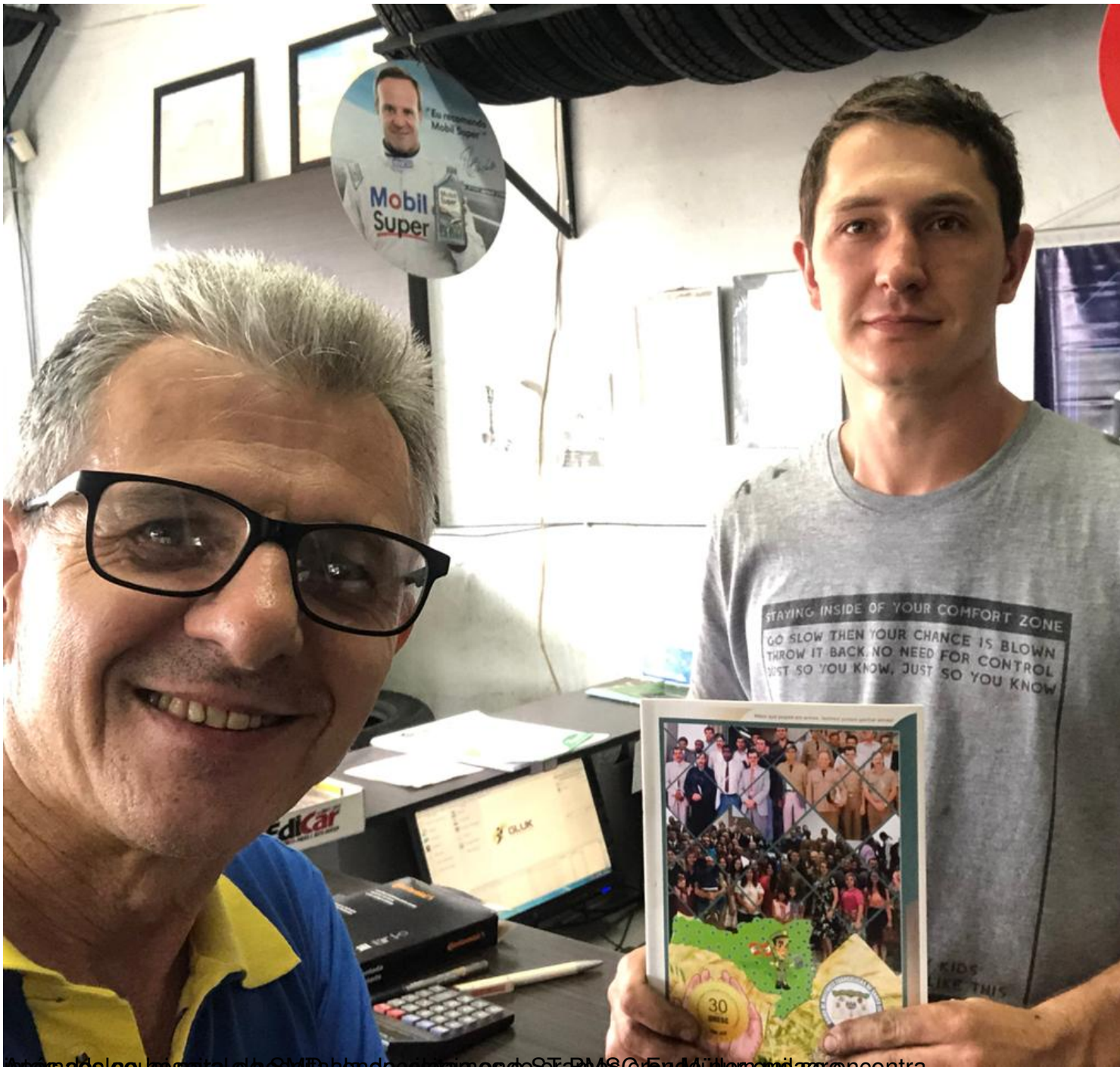
Após a reunião para o SPI da banda organizada por ST-PMSC em Dülmen que se encontra