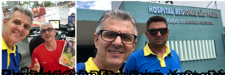
Visítamos a Paróquia do Cristo Rei em São Paulo e distribuimos revistas da BOM FIM. Depois de repartido a