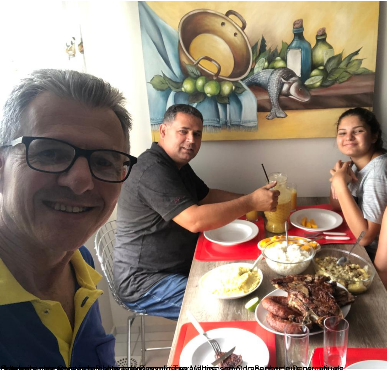
Segunda parte da visita à Biblioteca das irmãs Missionárias. Muitos servidos de carne e de peru.